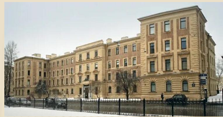
Санкт-Петербургский государственный педиатрический медицинский университет (СПбГПМУ) (в прошлом - Ленинградский педиатрический медицинский институт ЛПМИ).