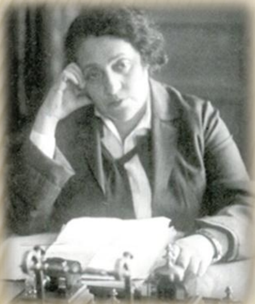
Ректор ЛПМИ (1925-1949)

С 1941-го по 1945-й Ленинградский педиатрический медицинский институт непрерывно работал, в самое сложное время стоял на страже материнства и детства. Ни на один день не прекращалась педагогическая, научная, лечебная и организационная деятельность.