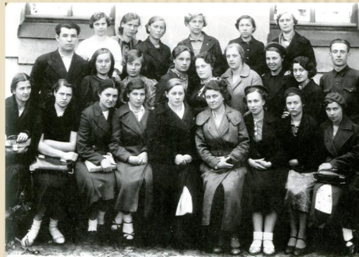
Группа выпускников 1942г.