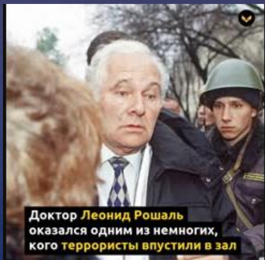
Доктор Леонид Рошаль оказался одним из немногих, кого террористы пустили в зал